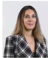
Virginie Prehoubert Maire de Saint-Brice-sous-Forêt