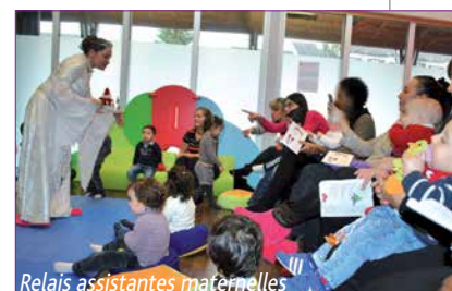
Relais assistantes maternelles

Décembre. Cette année encore, les tout-petits avaient les yeux qui brillaient à l'approche de Noël. Les différentes structures de la petite enfance ont offert aux enfants différents spectacles, magiques, musicaux ou malicieux, qui les ont ravis, sans oublier le petit goûter gourmand à partager avec maman et/ou papa. Certains auront même eu la chance d'apercevoir le Père Noël venu spécialement en avance pour apporter quelques cadeaux. Le rire des enfants, leur émerveillement restent, en tous les cas, le plus beau des cadeaux de Noël!