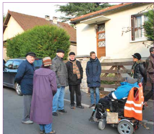
Des aménagements pour personnes à mobilité réduite sont prévus

Comme partout, hélas, ce quartier de Saint-Brice n'échappe pas à certains actes de malveillance voire délits. La présence de la police municipale aux Rougemonts a été saluée par le comité de quartier. Le maire a rappelé qu'il est important de ne pas hésiter à les appeler en cas de nuisances intempêtes.