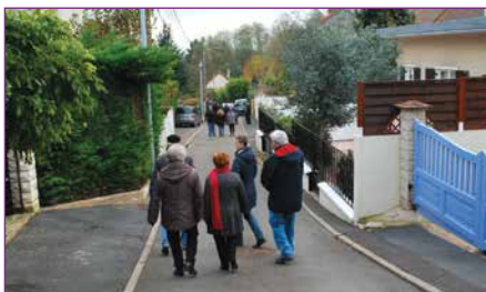
Allée des Cerisiers

De bas en haut, la visite des Rougemonts a permis d'aborder tous les sujets de préoccupation, avec en tête le déneigement des accès, très difficile sur des voiries pentues de 8 à 12 %. Ce quartier est donc, comme chaque année, prioritaire en cas d'intempéries. Cette prestation est déléguée à une entreprise car les services techniques de la Ville ne sont pas assez équipés. Rappelons qu'il faut bien dégager les axes pour que les engins puissent passer et qu'il est du ressort de chaque propriétaire de déneiger les trottoirs situés devant chez lui. La solidarité entre voisins peut alors être de mise pour les personnes qui ne pourraient le faire.