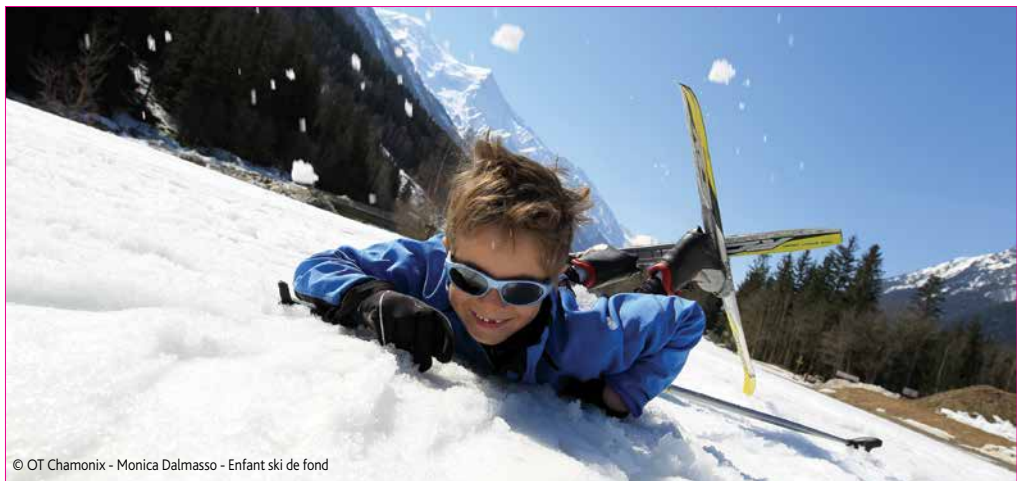
Enfant ski de fond

Du 31 janvier au 7 février, les élèves des écoles Jules Ferry et Jean de La Fontaine partiront aussi en Haute-Savoie, mais à Saint-Jeoire-en-Faucigny. Au programme, les incontournables activités de ski alpin