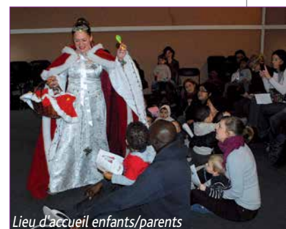
Lieu d'accueil enfants/parents