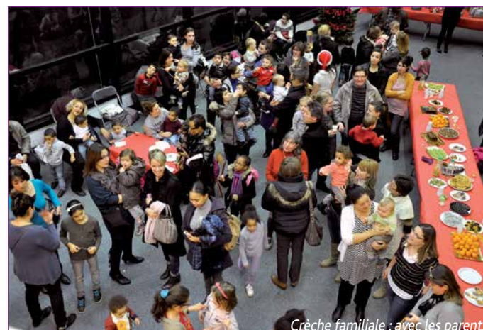
Crèche familiale : avec les parents