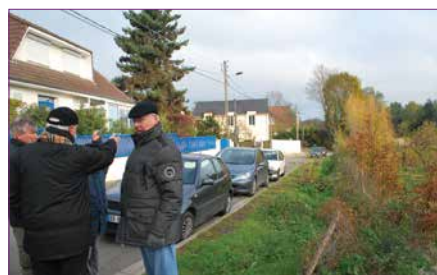
Aménagement des places de stationnement

D'ores et déjà, des poubelles devraient être installées aux arrêts de bus.