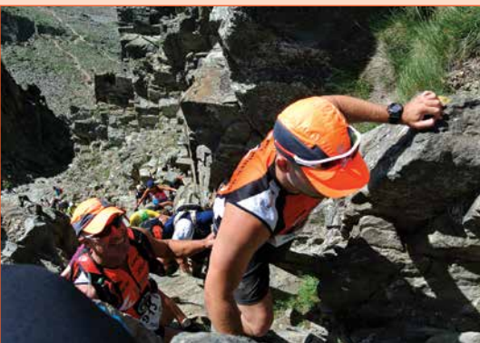
Ici, les sportifs d'Ulteamate Rider en pleine ascension du massif du Canigou dans les Pyrénées-Orientales. La photo représente l'arrivée au sommet, par le passage de la mythique cheminée, après environ 19 km d'ascension !

L'association Ulteamate Rider 95 recherche actuellement des soutiens financiers afin de mener à bien de nombreux projets, notamment dans la perspective de la saison 2014/2015. « Si nos futurs partenaires veulent retrouver leur logo et leurs coordonnées sur nos maillots et notre site internet, qu'ils n'hésitent pas à nous contacter » encourage le président de l'UTR 95. Déjà quelques partenaires ont rejoint l'aventure et permettent de faire vivre l'association. N'attendez plus, soutenez-les !