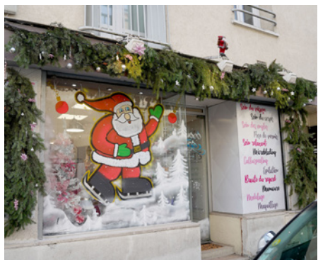
L'Amandine Institut, vainqueur de la catégorie commerces et vitrines