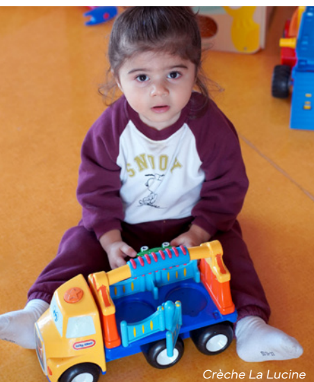
Crèche La Lucine

Tous les enfants, y compris ceux présentant un handicap ou une maladie chronique,