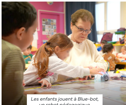
Les enfants jouent à Blue-bot, un robot pédagogique.