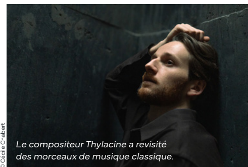
Le compositeur Thylacine a revisité des morceaux de musique classique.

Samedi 29 mars À 15 h, centre culturel Lionel Terray À partir de 14 ans Rens. et réservations au 01 39 33 01 85