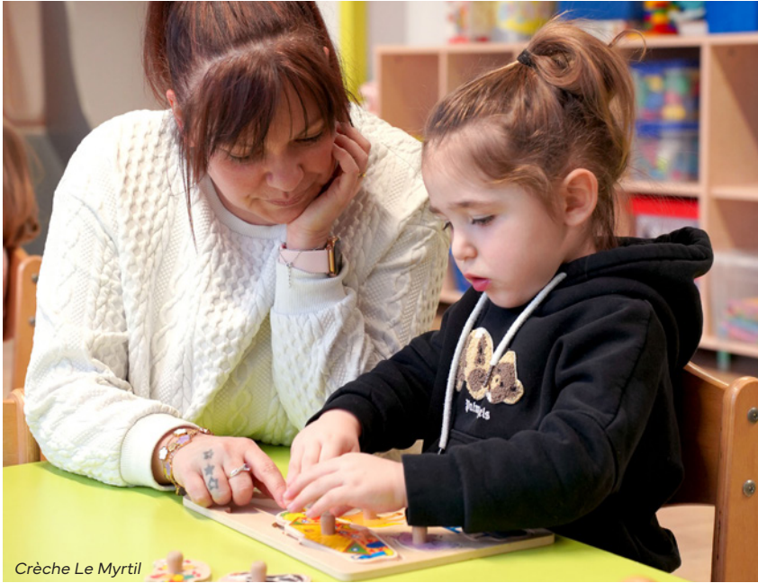
Crèche Le Myrtil

Cette approche permet également de répondre aux besoins spécifiques de certains enfants, en leur offrant un espace apaisant dans lequel ils peuvent se recentrer. « Le Snoezelen offre aux enfants un véritable cocon de douceur, idéal pour les aider à se recentrer et à mieux appréhender leurs émotions », explique Béatrice Gratian.